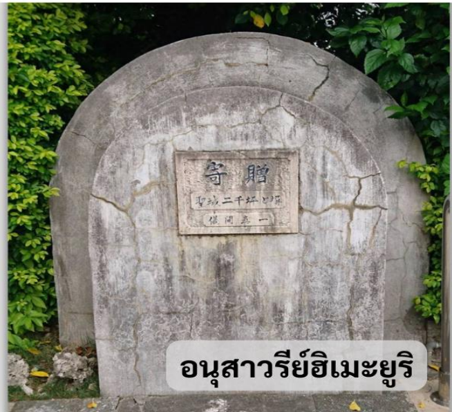
อนุสาวรีย์ฮิเมะยูริ

อนุสาวรีย์ฮิเมะยูริ ที่สร้างขึ้นเพื่อรำลึกถึงดวงวิญญาณของเหล่านักเรียนหญิงฮิเมะยูริที่ได้เสียชีวิตในสงครามโอกินาว่าในปี 1945 และปี 1989 โดยนักเรียนฮิเมะยูริคือนักเรียนหญิงมัธยมปลายและครูที่ได้เข้าไปมีส่วนร่วมในสงครามโอกินาว่าเพื่อดูแลผู้ป่วยขนาน้ำและอาหารให้กับกองทัพก่อนที่จะเสียชีวิตลงจากลูกหลงของการสู้รบที่รุนแรงขึ้น