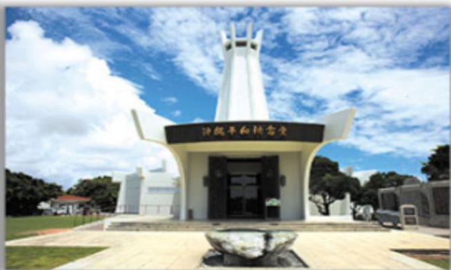
สวนสันติภาพ

สวนสันติภาพ อนุสาวรีย์ที่เป็นสัญลักษณ์ของการสันติภาพ ซึ่งตั้งอยู่ท่ามกลาง สวนสาธารณะ และอุทยาน สวนมีทางล้อมรอบโดยเสาอุปราชที่ออกแบบมาเป็นสัญลักษณ์ ของความสันติภาพ เป็นอนุสรณ์เพื่อรำลึกถึงผู้ที่เสียชีวิตในสมรภูมิที่โอกินาว่าในช่วงสงครามโลกครั้งที่ 2 ซึ่งเป็นหนึ่งในสมรภูมิที่นองเลือดที่สุดในสงคราม